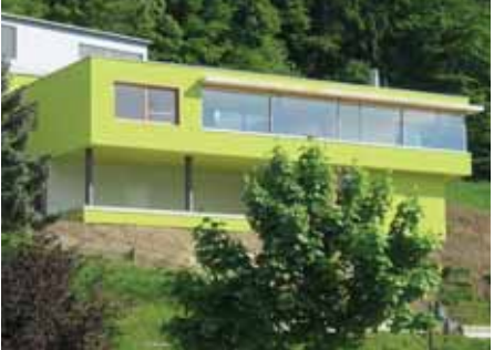
Baujahr: 2005 Objekt: Einfamilienhaus Architekt: Hopf Silke & Wirth Toni, Winterthur CH Standort: Mühlethal CH