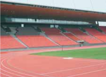
Baujahr: 2007 Objekt: Stadion Letzigrund Architekt: Béatrix & Consolascio, Erlenbach CH Standort: Zürich CH

Ceci ne représente que quelques unes des références de Sky-Frame. Vous trouverez une liste toujours actuelle à www.sky-frame.ch . Vous y trouverez également d'autres informations utiles sur tout ce qui a trait à Sky-Frame.