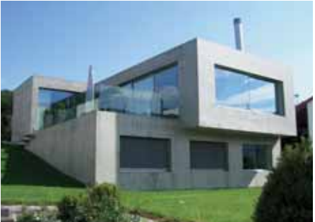
Baujahr: 2005 Objekt: Einfamilienhaus Architekt: Beck + Oser, Basel CH Standort: Hofstetten CH