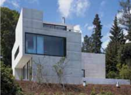
Baujahr: 2006 Objekt: Einfamilienhaus Architekt: Müller Verdan Weineck dipl. Architekten ETH/SIA, Zürich CH Standort: Rüschlikon CH