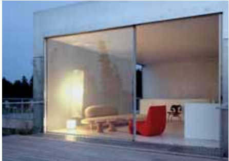
Baujahr: 2004 Objekt: Haus der Gegenwart Architekt: Allmann Sattler Wappner, Architekten, München D Standort: München D