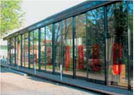
Baujahr: 2005 Objekt: Restaurant Architekt: Riehle + Partner, Reutlingen D Standort: Metzingen D