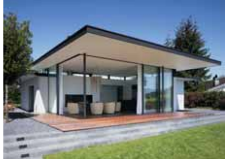
Baujahr: 2006 Objekt: Einfamilienhaus Architekt: Meier Architekten, Zürich Standort: Zürichsee CH