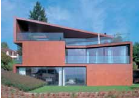
Baujahr: 2004 Objekt: Einfamilienhaus Architekt: Wild Bär Architekten AG, Zürich CH Standort: Küsnacht ZH, CH