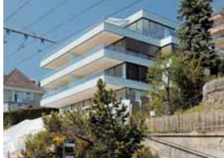
Baujahr: 2006 Objekt: Mehrfamilienhaus Architekt: Leutwyler Partner, Zug CH Standort: Zürich CH