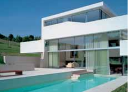
Baujahr: 2005 Objekt: Einfamilienhaus Architekt: Project A.01 Architects ZT GmbH, Wien A Standort: Klosterneuburg A