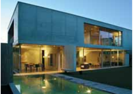
Baujahr: 2006 Objekt: Einfamilienhaus Architekt: Attilio Panzeri, Lugano CH Standort: Lugano-Sorengo CH