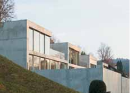
Baujahr: 2005 Objekt: Mehrfamilienhaus Architekt: Peter Kunz Architektur, Architekt FH/BSA, Winterthur CH Standort: Winterthur CH