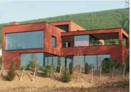
Baujahr: 2006 Objekt: Einfamilienhaus Architekt: Eggenschwiler AG Architekten ETH/SIA, Laufen CH Standort: Châtillon CH