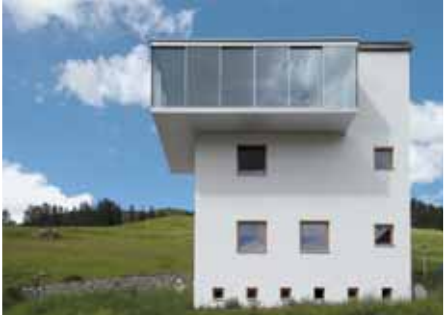
Baujahr: 2006 Objekt: Einfamilienhaus Architekt: Roger Vulpi, Guarda CH Standort: Guarda Engadin CH