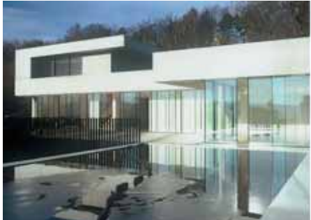
Baujahr: 2003 Objekt: Einfamilienhaus Architekt: Peter Kunz Architektur, Winterthur CH Standort: Winterthur CH